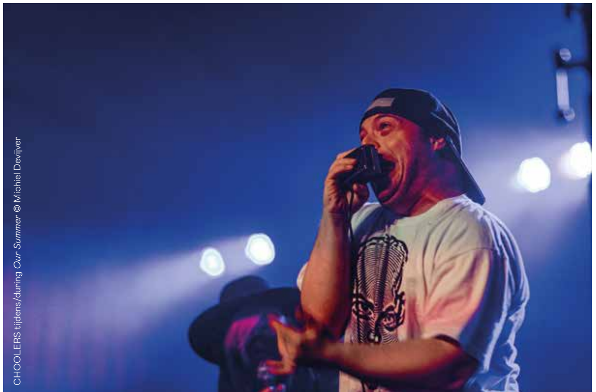
CHOOLEERS tijdens/during Our Summer

eng Since September, Voo?uit's programme no longer fits the traditional theatrical season. We now divide the year into three parts: Our Fall (September-January), Our Spring (February-May) and Our Summer (June-August). No winter at Voo?uit! In summer, we focused on development, with partners and artists who longed for more space. They took over our house while the majority of our employees went on holiday. By programming shortly in advance, we were able to support artists who find it harder to get included in the long-term plans of (inter)national theatre companies and concert venues. This gave them a chance to show themselves to the world.