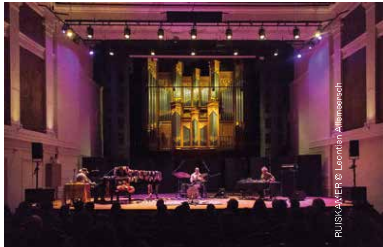
RUISKAMER