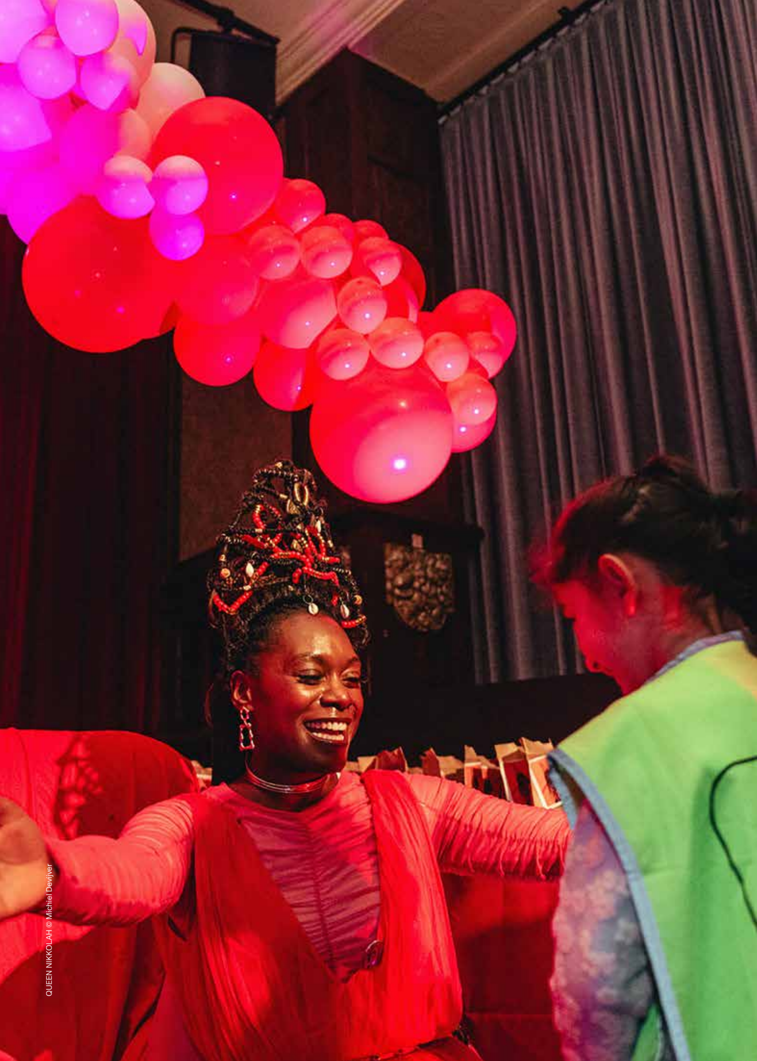
QUEEN NIKKOLAH © Michiel Devijver