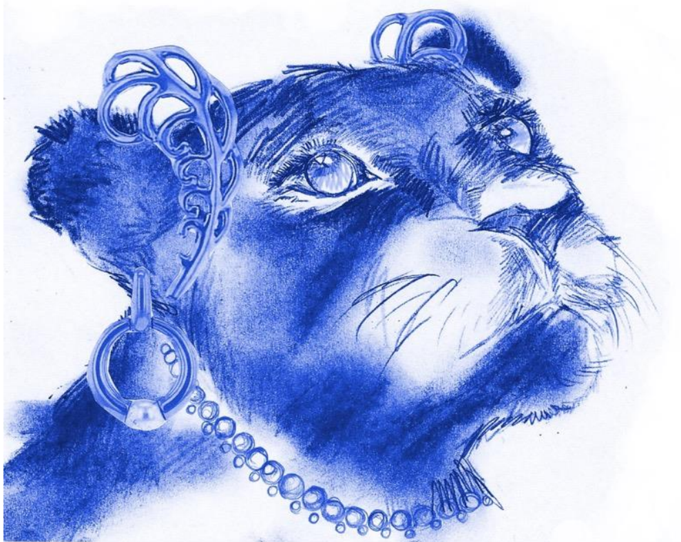
Tekeningen: Aline Breucker

Je kan en mag doen wat je nodig hebt om je goed te voelen.